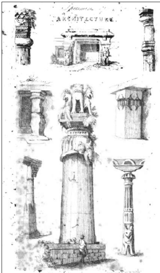
Figura 1 – Desenhos de colunas. Apud Maria Graham. Letters on India , p. 58.